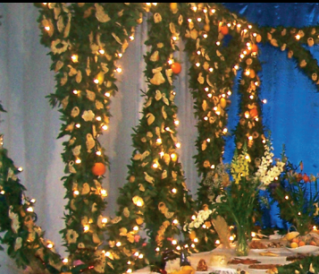
Altar de San José

naturaleza, Jesús, María y José, y característicos cucciddati , gruesas rosquillas. A las Vírgenes, en otro tiempo tres pobres identificados con la Sagrada Familia, se les ofrece, ante el altar votivo, una comida de numerosos platos, por la gracia recibida tras una curación o como auspicio de un trabajo o la buena cosecha.