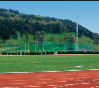
Centro polideportivo San Jacobo

que hace de base la aerosuperficie en la zona de Bovarella, en una posición baricéntrica entre el nudo de la autopista A29 y el centro de la ciudad. Las numerosas asociaciones ciudadanas organizan durante el año diversos eventos culturales y teatrales que diversifican y completan la riqueza de la ciudad.