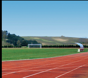
Centro polideportivo San Jacobo