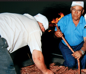
Fête de la saucisse

pas au rendez-vous non religieux qui a lieu le 12 et 13 septembre, la traditionnelle Foire de S.Vito. Pendant les célébrations en l'honneur de Santa Ninfa, le 12 novembre, a lieu la Fête du pane cunsatu . Au près du centre omnisports, les manifestations sportives, même de grande importance, ne manquent pas.